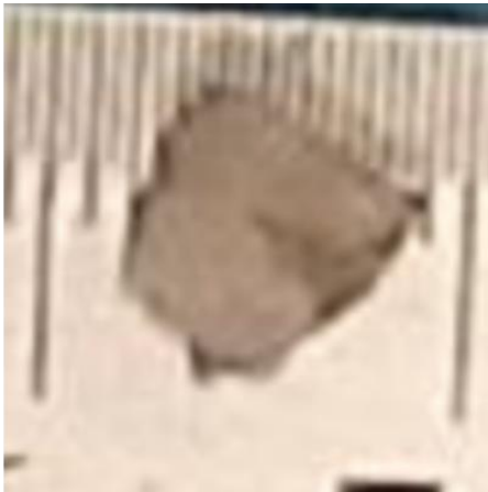
Макропрепарат удаленного образования Макрофото #1.

Макроописание: Фрагмент ткани серого цвета р. 0.5x0.5x0.2 см.